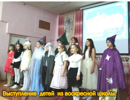
Выступление детей из воскресной школы.

В этот же день, в средней школе № 2, состоялась традиционная благотворительная Рождественская ёлка, организованная для детей из многодетных и малоимущих новомайнских семей, но двери на праздник были открыты для всех.